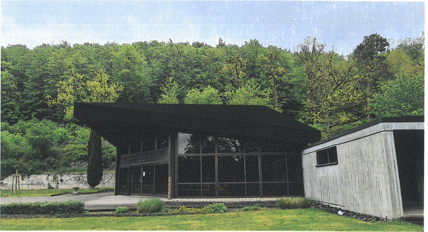
Abbildung 3 Fotomontage