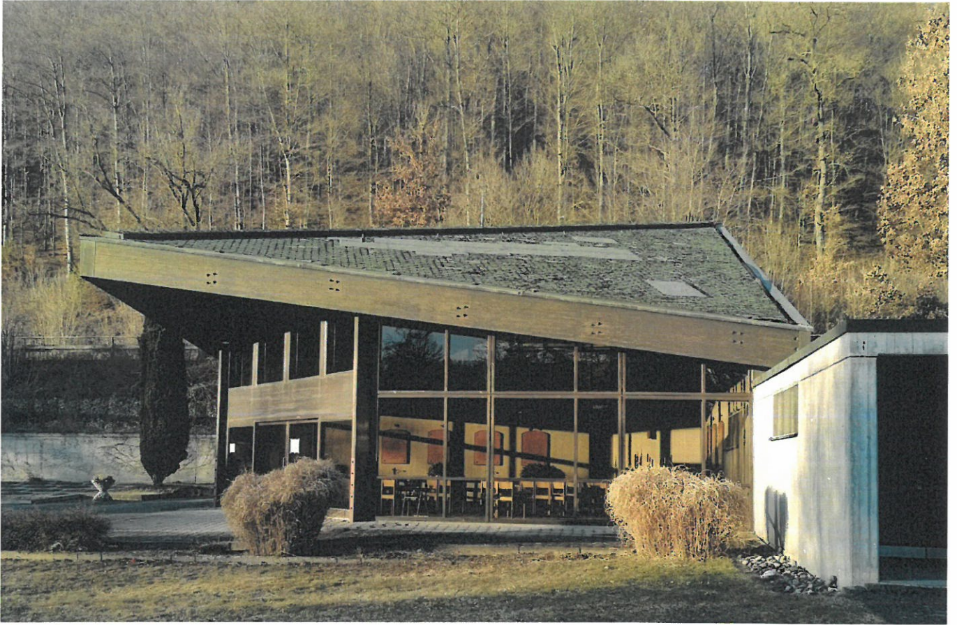
Abbildung 1 Bildmaterial vom Bestand