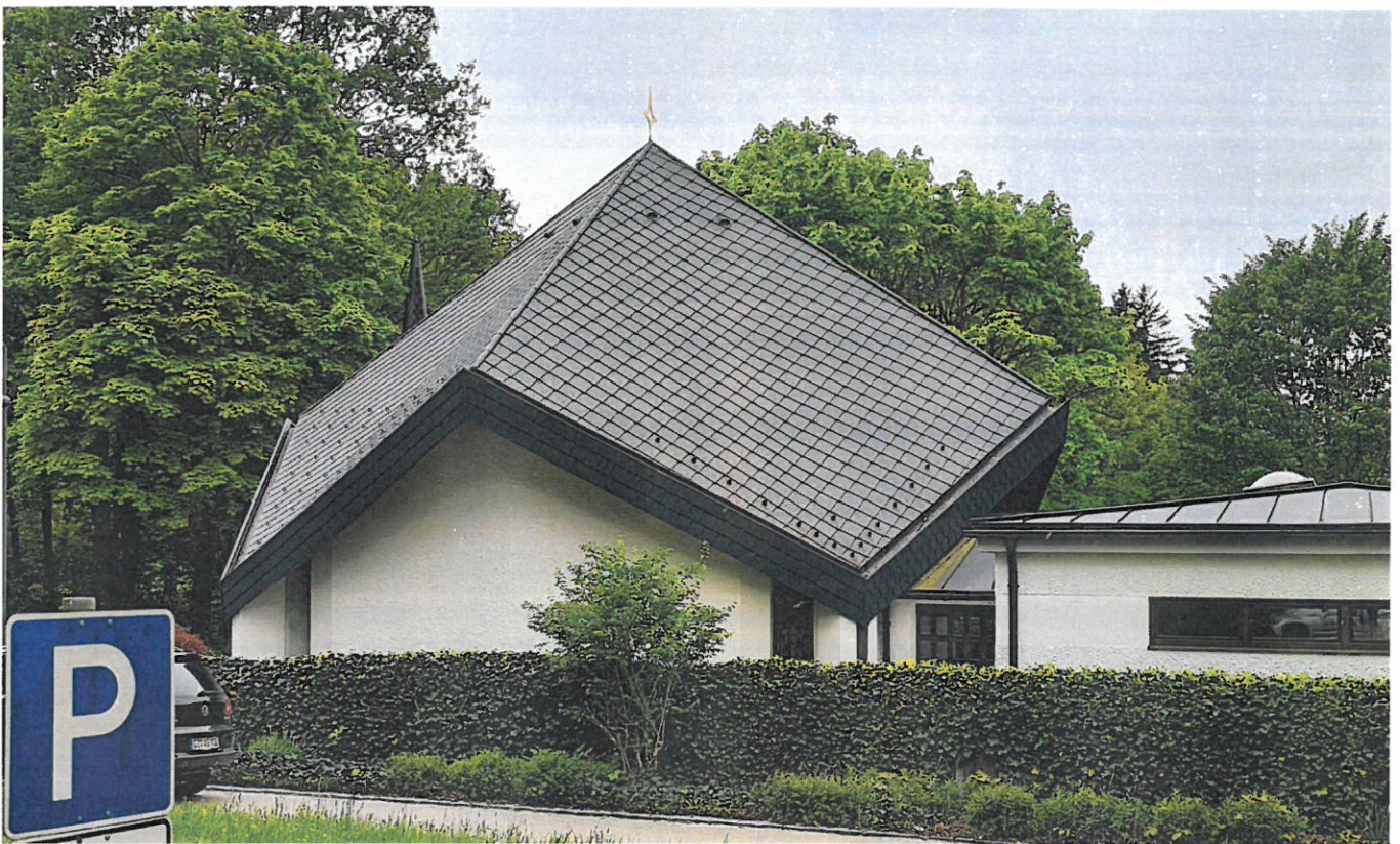
Abbildung 2 Referenzobjekt Aussegnungshalle Thannhausen